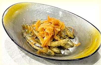
きびなごの南蛮漬け 770円 (税込)