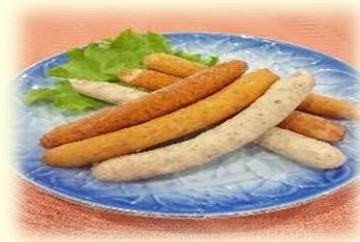
ソーセージ盛合せ