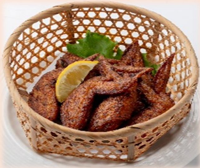
人気NO. 1 手羽先黄金揚げ