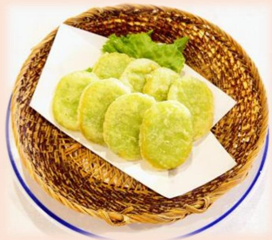
そら豆天 770円 (税込)