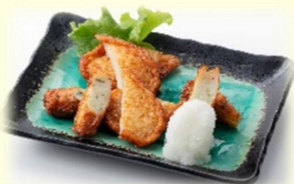
さつまあげ 770円 (税込)