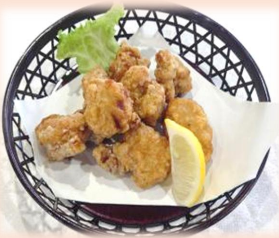
鶏の唐揚げ 1,210円 (税込)