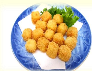
チーズかりかり揚げ