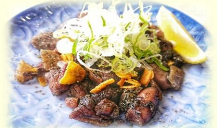
鶏の炭火焼 990円 (税込)